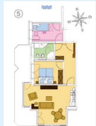
Grundriss Wohnung 5 mit 1 SZ, 1 Bad = 63qm mit Kinderzimmer 75 qm