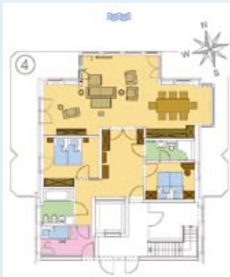
Grundriss Wohnung 4 mit 2 SZ, 2 Bäder = 130 qm mit Kinderzimmer 143 qm