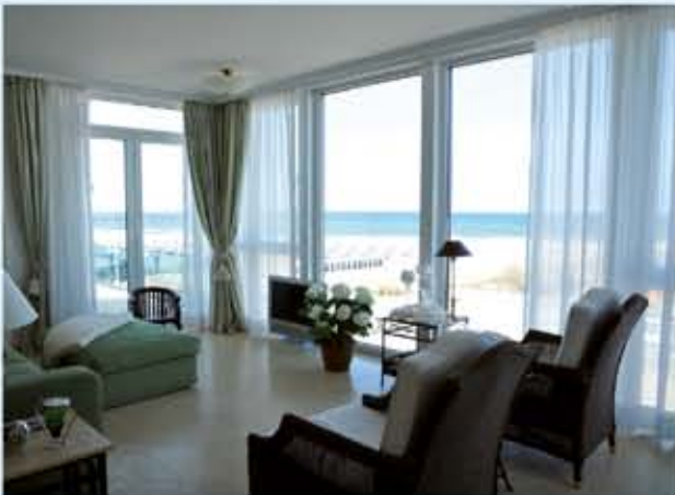
Wohnzimmer der Wohnung 4 mit Panoramablick. Alle Wohnungen haben Meerblick und sind individuell eingerichtet.

Sieben traumhafte exklusive Ferienwohnungen; 63 – 205 qm; 1 – 4 Schlafzimmer. Auch für einen Mehrgenerationenurlaub. Panorama-Seeblick! Ideal für Allergiker: rauch- und tierfrei , Marmorböden, jede Wohnung mit eigener Luftfilter-Lüftung. Neueste Technik: „intelligentes Haus“; hoher Sicherheitsstandard. Großzügige Ausstattung für einen gepflegten Lebensstil.